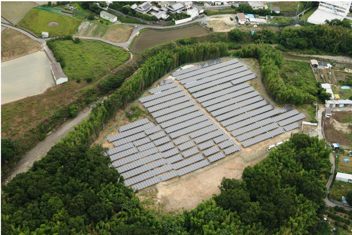
第一期工事完成写真